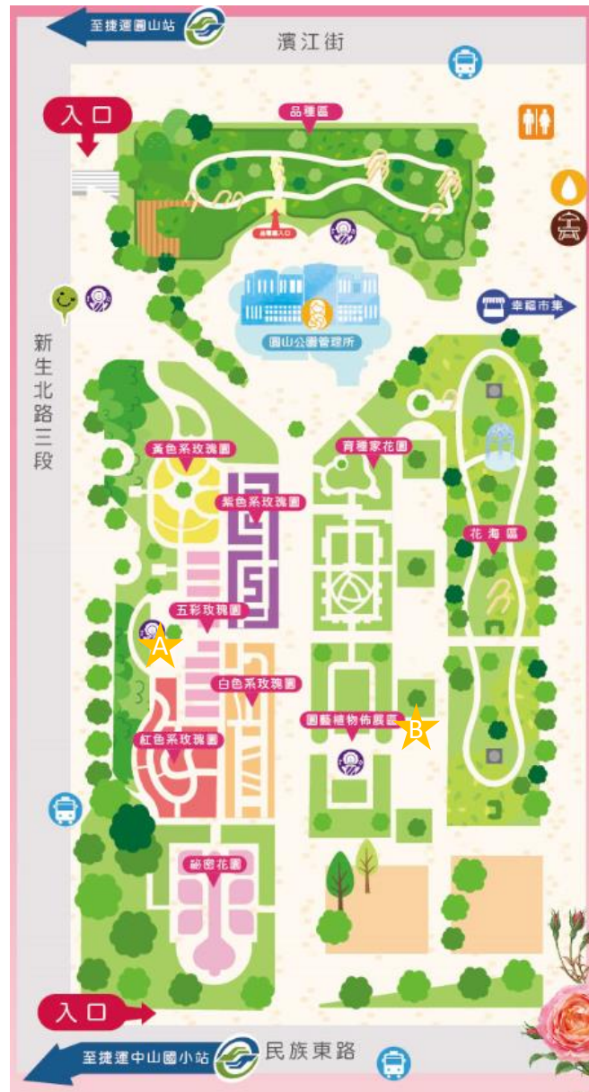
街頭藝人展演地點平面示意圖