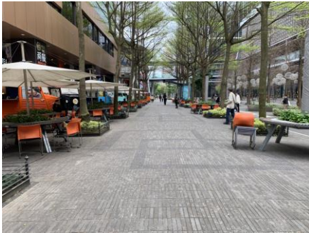
南大門前戶外步行區