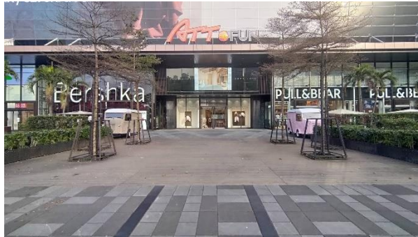
松智路戶外廊道(Zara Home 面松智路前方廣場)