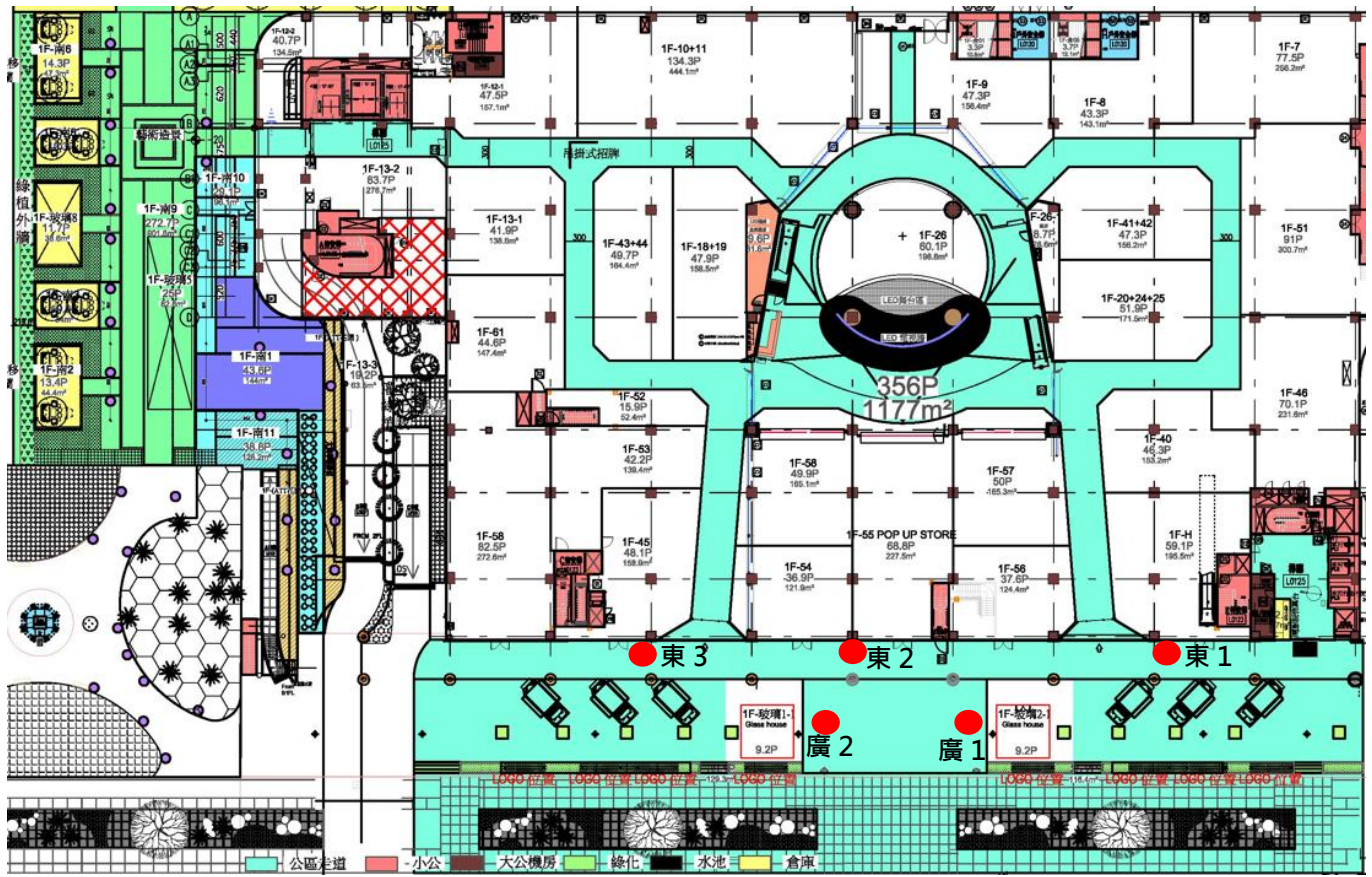
東 1 門